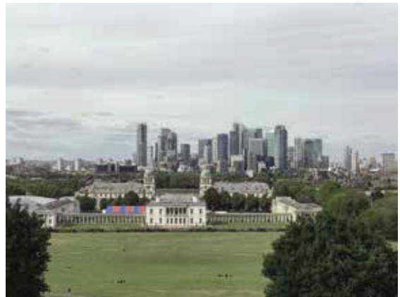
格林尼治地區—被列入世界遺產，有舊皇家天文台及海軍學院。