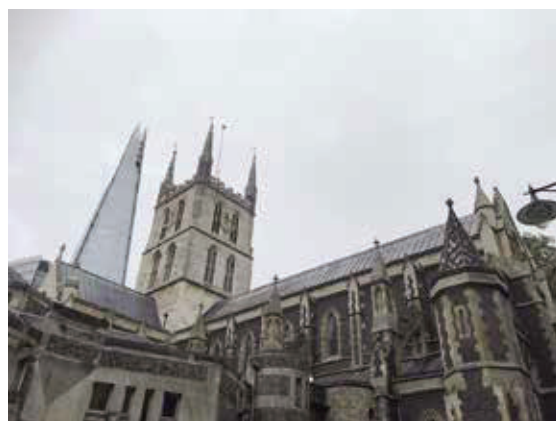
南華克主教座堂—有八百年歷史，建築外觀很細緻，後面是碎片樓。