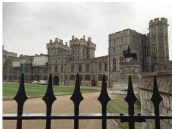
溫莎堡—12世紀後成為英王的行宮，開放王室宅第及聖喬治教堂參觀。