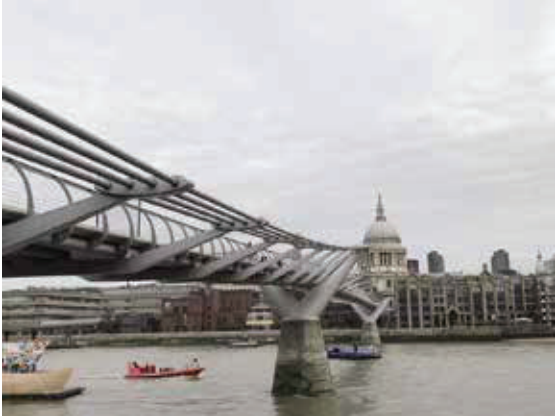
千禧橋—長325公尺的人行專用橋，Y形支柱設計，搭配鋼索橫臂，視野開闊。