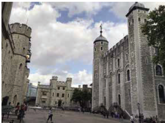
倫敦塔—22個古堡建築群，是1066年諾曼征服英格蘭的產物。