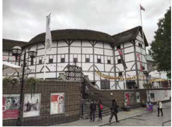
莎士比亞環球劇場—1997年模仿莎士比亞年代原始劇場所建劇院。