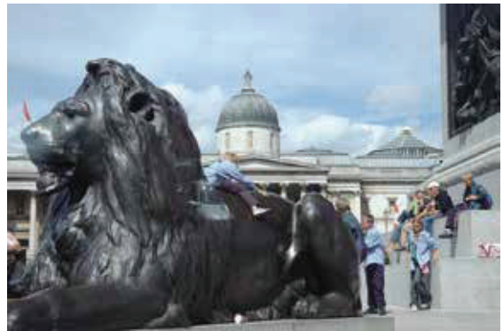
特拉法加廣場—1805年紀念海軍上將納爾遜，在特拉法加打敗法西聯軍所建。