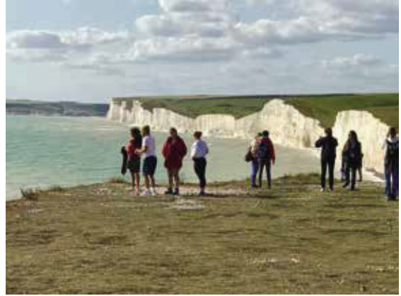
七姐妹岩—英吉利海峽的白堊斷崖，雪白的峭壁，上面有如茵的草地。