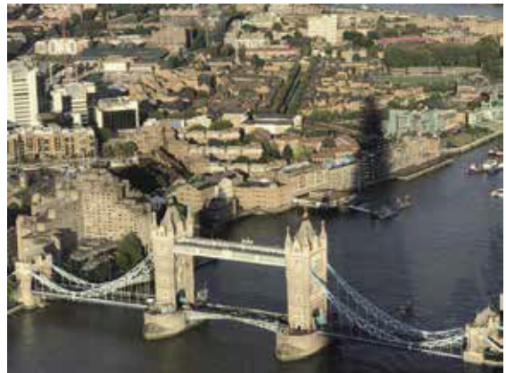
塔橋為裝飾性維多利亞新哥德式，有上下兩層，上層是行人專用。