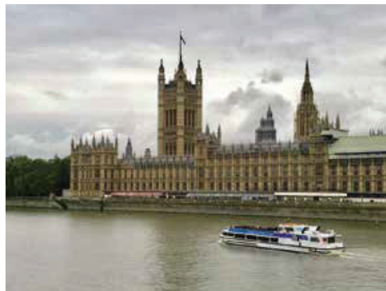
西敏宮—即英國國會，11世紀愛德華一世皇宮，19世紀重建為新哥德式樣的議會大樓。