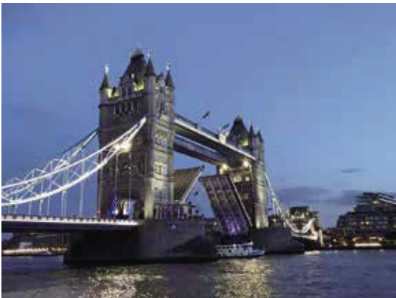
倫敦塔橋—1894年落成，全長244公尺，有兩面橋板可以開啟。