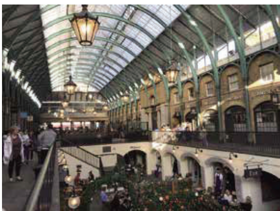
柯芬園—舊市場改建的購物中心，一旁是皇家歌劇院。