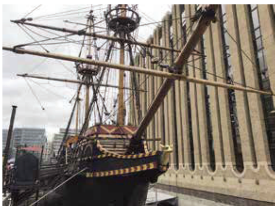
金鹿號紀念艦—展示在南岸倫敦橋西側的西班牙式三桅大帆船複製品。