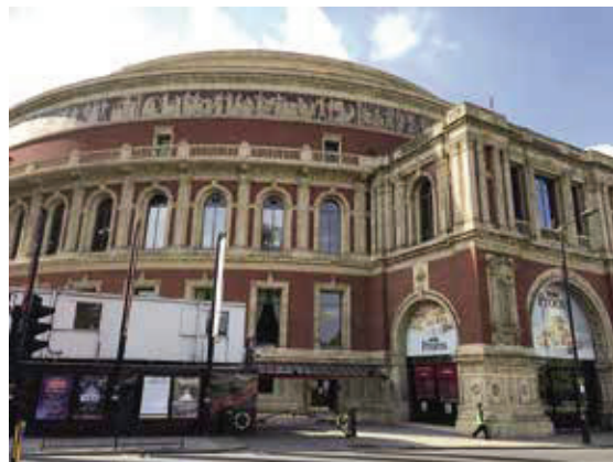
皇家亞伯特廳—1871年揭幕模仿羅馬式的圓形劇場，倫敦最重要的大眾音樂廳。