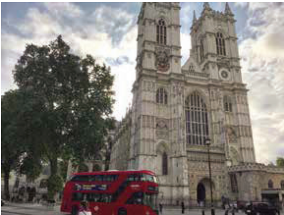
西敏寺—1065年至今是歷代英王的安葬或加冕地點，列入世界遺產。