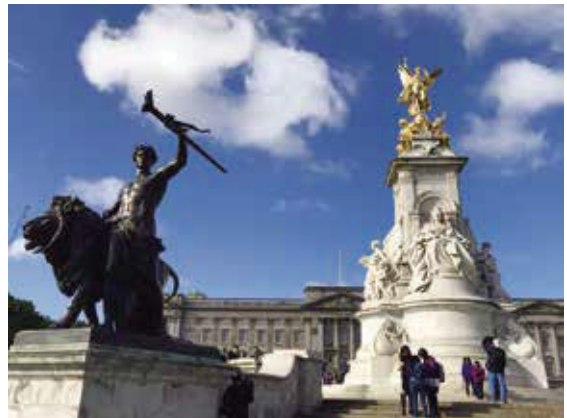
白金漢宮—英王正式宮寢，國家慶典和王室歡迎儀式舉行地。