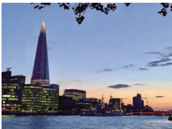
碎片樓—309.6米，英國第一高樓，2013年落成，由一萬一千玻璃帷幕組成。