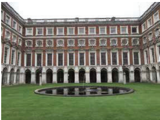
漢普頓宮—有英國的凡爾賽宮之稱，建於1515年，是紅色都鐸式皇宮的典範。