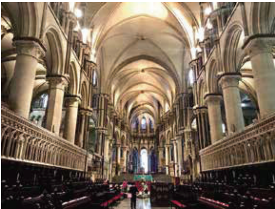
坎特伯里大教堂—英國國教主座教堂，列聯合國世界遺產。