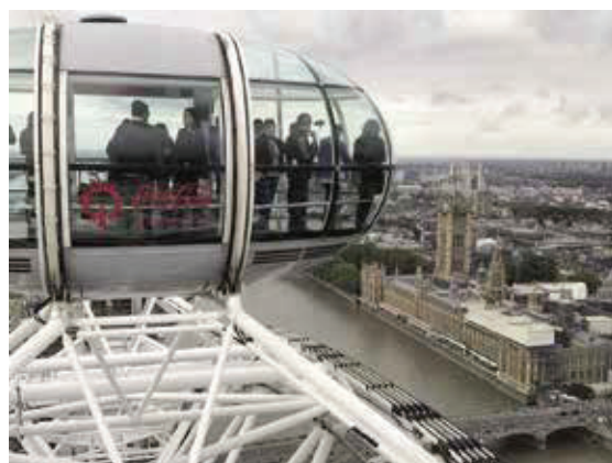
倫敦眼—亦稱千禧輪，高度135米，規模世界上第四，一圈約30分鐘。