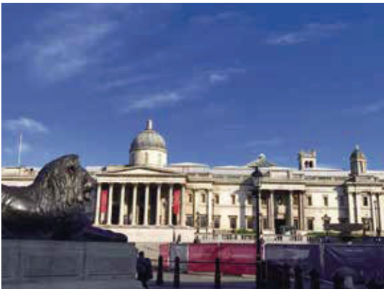
國家畫廊—倫敦最重要的美術館，收藏文藝復興期、法蘭德斯、印象派的作品。