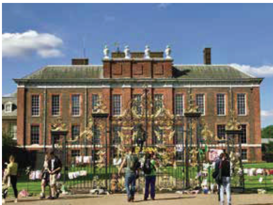
肯辛頓宮—威廉王子夫婦正式官邸，門口擺滿紀念戴妃的花束卡片。