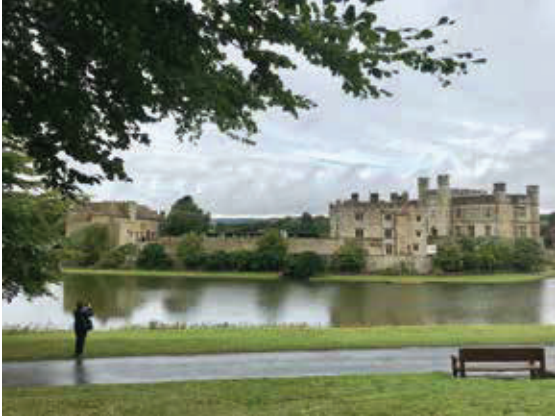
麗茲古堡—在倫敦近郊，有九百年歷史，有全世界最可愛城堡之稱。